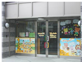
西平井保育園 南流山保育ステーション 南流山 4-1-14 TEL 04-7159-7475