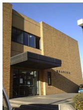
南流山福祉会館 南流山 3-3-1 TEL 04-7159-9300