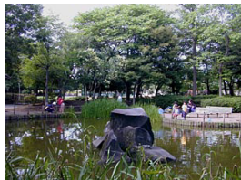
南流山中央公園 (南流山3丁目)

区画整理事業により街がつけられた南流山には、各地域に計画的に公園が配置され、子供たちの遊びの場や市民の憩いの場として利用されています。中央公園で8月下旬、南流山連合協議会の夏祭が開催されます。