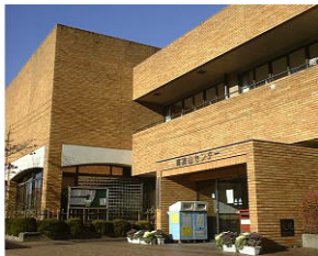
南流山センター (市役所支所) 南流山 3-3-1 TEL 04-7159-4511