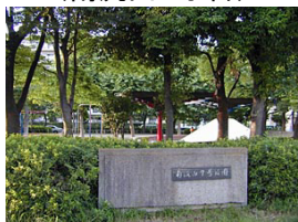
南流山7号公園 (南流山6丁目)