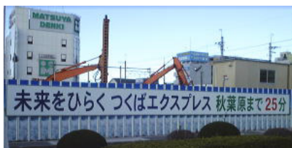
南流山駅地下工事

南流山駅から秋葉原へは JR を利用して西船橋乗換で約 55 分かかりますが、つくばエクスプレス（旧名称：常磐新線、平成 17 年開通予定）ができると 25 分で乗り入れ予定です。