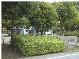
南流山1号公園 (南流山4丁目)