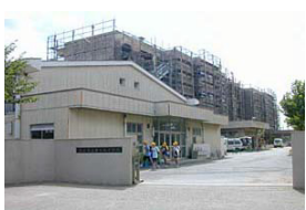
鱒ヶ崎小学校 鱒ヶ崎 7-1 TEL 04-7158-5911