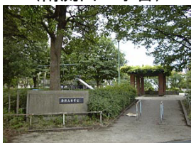
南流山4号公園 (南流山2丁目)