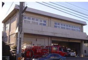
流山消防署南分署 南流山 3-9-6 TEL 04-7159-0119