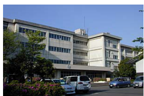
南流山中学校 流山 2539-1 TEL 04-7159-2551