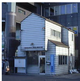
流山警察署 南流山駅前交番 南流山 1-1-1 TEL 04-7159-6211