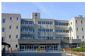
南流山小学校 木 487 TEL 04-7159-2521