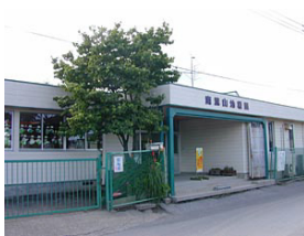
南流山幼稚園 流山 2526 TEL 04-7159-7050