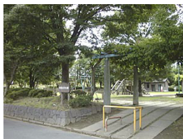
南流山9号公園 (南流山5丁目)

赤城神社、一茶双樹記念館は、県道松戸野田線の流山5丁目の交差点の近くにあります。流山市総合運動公園は更に野田側に向かい、流山市役所と案内標識のついた交差点を右折し、直進しますと、左手に見えて