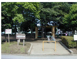
南流山5号公園 (南流山6丁目)