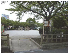
南流山2号公園 (緒ヶ崎)