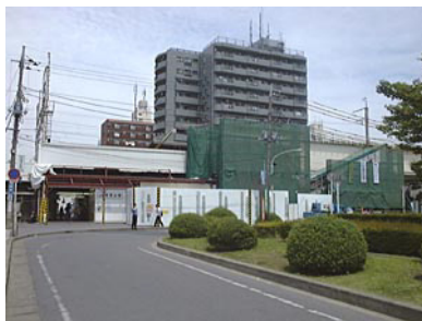
JR 南流山駅(江戸川側出口)

南流山駅から秋葉原へは JR を利用して西船橋乗換で約 55 分かかりますが、つくばエクスプレス（旧名称：常磐新線、平成 17 年開通予定）ができると 25 分で乗り入れ予定です。