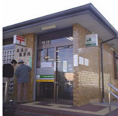
南流山郵便局 南流山 6-7-1 TEL 04-7159-7633