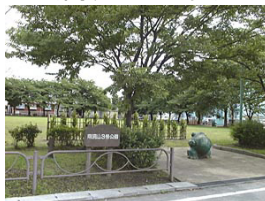
南流山3号公園 (南流山1丁目)