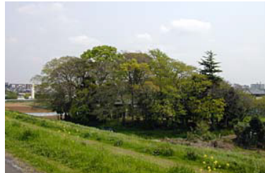
江戸川近くの香取神社の雑木林