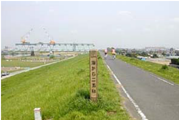
江戸川堤防・海から 25km ポスト