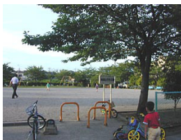
南流山8号公園 (南流山7丁目)