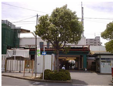
JR 南流山駅(鰭ヶ崎側出口)

鉄道は JR 武蔵野線南流山駅が最寄駅となります。東京駅へはむさしのドリーム号で約 45 分で到着します。現在、駅舎はエレベータ設置などの改修工事で写真のような状態になっています。