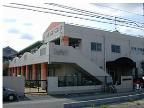
なかよし保育園 南流山 7-5-1 TEL 04-7158-5500