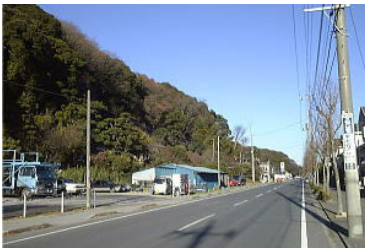
鱈ヶ崎駅を越えた側に広がる森

JR 南流山駅の江戸川側出口を出て、「江戸川河川敷緑地」へは徒歩で約 15 分で到着します。江戸川河川敷の流山側の堤防には松戸・野田・関宿自転車道、三郷側には三郷・幸手自転車道が整備されていて、ジョギング、サイクリングを楽しむ人が多くいます。野田市との境にある運河水辺公園までは流山橋から約 10km の距離、サイクリングを楽しむにはちょうどよい距離です。また、大気の澄んでいる冬の早朝などには、江戸川越しに遠くに富士山を見ることもできます。