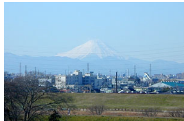
富士山（2002年1月3日撮影）